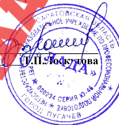
ГРАФИК проведения аттестации педагогических работников на соответствие занимаемой должности 2014 – 2018 гг.